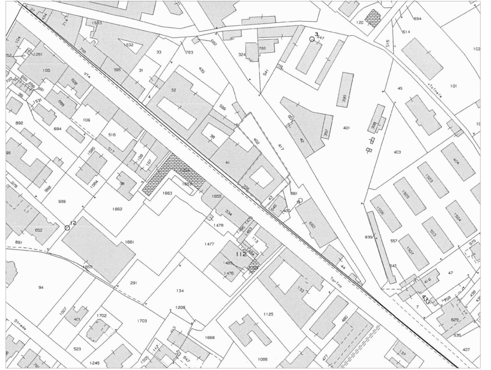
ESTRATTO DI MAPPA (1:2000)